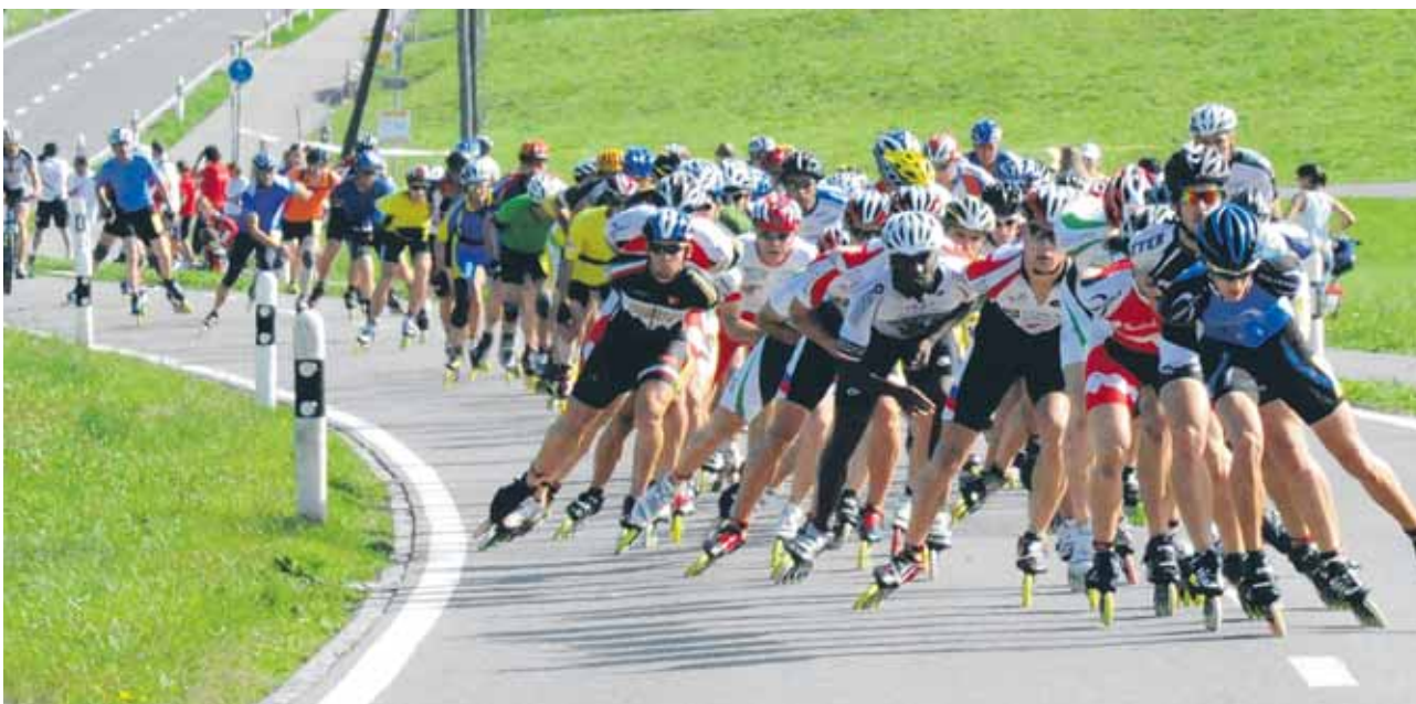
Windschattenfahren als optisch interessantes Fotosujet.